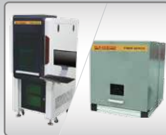
Buồng làm việc/bảo vệ