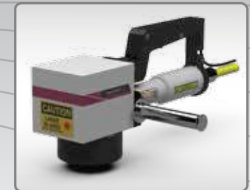
Cụm đầu khắc Mobility