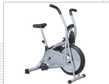
Thiết bị tập thể dục [Fitness equipment]