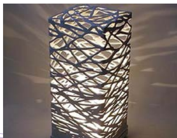
Đèn trang trí [Decorative lighting]