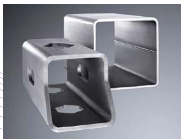
Vật liệu hình ống [Tube element]