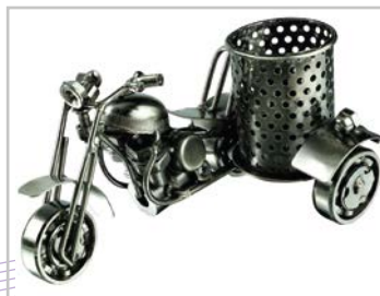
Kim loại thủ công [Metal crafts]