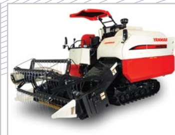
Máy móc nông lâm nghiệp [Agriculture and forestry machinery]