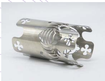
Cắt ống [Pipe cutting]

● Kim loại hợp kim [Alloy metal materials]